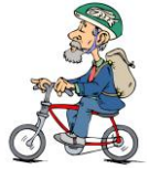
ride a bicycle