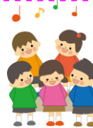
sing a song