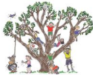
climb a tree