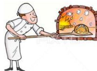
bake a pie