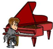
play the piano