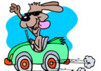
drive a car