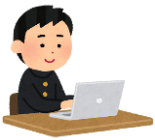
use a computer